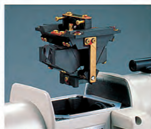
エアードンパー方式コンベンセーター

補正鏡は望遠鏡の平行光束中にあり、本機の傾きによる補正鏡の位置変化時の補正誤差、ピントのズレによる像のボケは生じません。また、振子は特殊弾性リボン材で逆台形に吊られており、本機の傾きに対し6倍の敏感さで補正します。さらに、使用条件に左右されず永久的に制動効果を発揮する空気制動方式ダンパー、エアースキ間が広く微振動の制動にも効果がある特殊構造のピストン・シリンダーを採用しており、常に安定した精度を維持します。