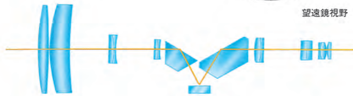
明るくシャープな望遠鏡光学系