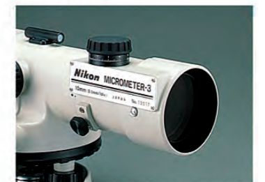
オプティカルマイクロメーター3型(オプション)