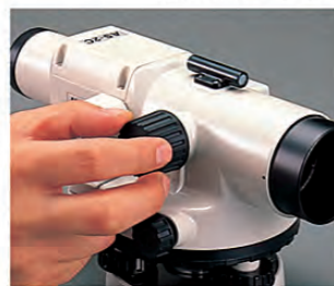
一軸粗微動合焦方式

粗動と微動、2つの機能を備えた一軸粗微動合焦方式。スピーディ、かつ確実なピント合わせが行えます。