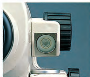
気泡管用ペンタミラー

視準の姿勢を変えずに、ちょっと視線をズラすだけで気泡像が見られる、気泡管用ペンタミラーを採用。像は正像ですから、まぎらわしさもありません。