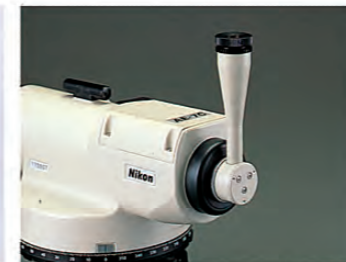
ダイアゴナルアイピース(オプション)