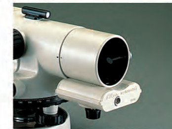
オプティカル照明装置3型(オプション)

単三形乾電池で簡単に使える照明装置(ASシリーズと共用)。望遠鏡の先端に取り付けて、望遠鏡の十字線を照明します。