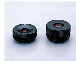
望遠鏡接眼レンズH/L(オプション)

ネジ込み式で交換が簡単な交換用接眼レンズを、高倍率(H)/低倍率(L)の2種類をご用意しました。ダイアゴナルアイピースの取り付けも可能で、使用範囲は一層大きく広がります。